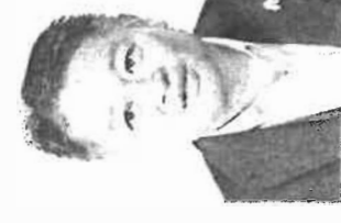
ながさき こうたろう 1991年大蔵省入省。2005年 から衆議院議員、通算3期。 17年山梨県知事、19年2月 から現職。

賃上げは、大企業に比べてはるかに大きい。労働分配率は大手の製造業に比べて中小は約80%引き上げで割増が確保できるところもない。 ただ、もともと大企業に比べて中小の賃金は低く、上げの余地は狭く、しかも非正規社員も増え、賃金を上げを許すのは本来あるべき姿ではない。賃上げを引き上げを前提からには、中小が賃上げしやすくなる環境を整えて取り組むべき。 2025年10月6日、公明党の中小企業部会、政府が賃上げ額1500円への引き上げを決定したところから見て、政府は「対企業」として「対労働者」としての両面から賃上げの効果を高める必要がある。サライ