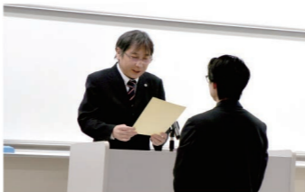
▲採択式で通知書を授与される学生

3月6日、2026年度南山チャレンジプロジェクトの採択式を開催しました。採択された5団体は、掲げた取り組みについて1年を通じて活動を行います。【採択団体】がくそん、Nanzan AID、漕艇部、学生団体ECHO、UniVo