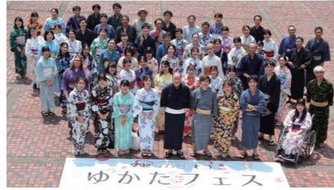
▲昨年のゆかたフェスの様子

7月12日(日)には、昨年に引き続き「南山ゆかたフェス×松坂屋コラボファッションショー」を開催予定です。学生によるアレンジした着付けをぜひ見に来てください。