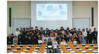
▲昨年の東海学生刑法学会

的にものを考える訓練をしてきた成果は、近隣大学の刑法ゼミとの合同討論会「東海学生刑法学会」に生かされます。刑事政策の「いま」を探るのも学生と一緒にです。夏には、私が特に注目する施設等に赴いて、処遇の現場を見学しています。矯正施設に行くことが多いですが、昨年は初めて入管施設を見学しました。ゼミ活動を通じて、ゼミ生同士、さらには他大学の学生やゼミのOB/OGとも交流を持てる環境づくりを意識してきました。いまや学生が関心のあることを自発的に教えてくれるので、それに乗るだけで安定したゼミ運用ができる環境が育ってきました。今後よりいっそう、この緑多いキャンパスで、学生たちとともに学び、ともに遊んでいければと思っています。