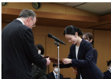
▲キサラ学長より盾が授与されました

卒業予定者のうち品行方正で、学業あるいは課外活動で特に優れた成績をおさめた学生、または特に顕著な善行が在学中継続した学生31名に、その努力と栄誉を称え、学長から盾が授与されました。