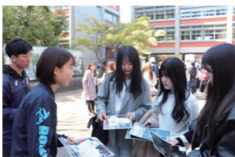
▲メインストリートの様子

3月31日から4月3日までの4日間、フレッシュマン祭を開催しました。新入生向けにクラブ・サークル紹介をするため、今年は93団体がキャンパス内でチラシの配布や勧誘活動、教室やフラッテンホール、体育館、グリーンエリア等でのイベントを実施しました。