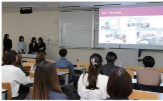
▲報告会で発表をする学生

3月6日、2025年度南山チャレンジプロジェクト活動報告会を実施しました。「南山チャレンジプロジェクト」は学生による学内を活性化する企画や地域との交流、国際交流などを推進する取り組みを大学として支援し、学生の成長につながる多様な機会を創出することを目的としています。採択された2団体が、1年の活動を振り返り、実施した企画や、活動の中で生じた困難な状況をどのように乗り越え、何を学んだか等を発表しました。【採択団体】Nanzan AID、PE project