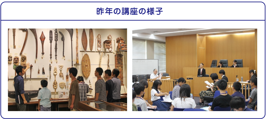
昨年の講座の様子