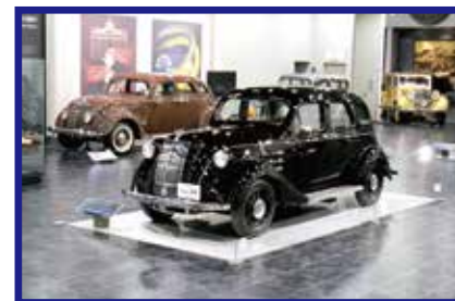
Bảo tàng Xe hơi Toyota