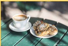
写真はイメージ図です。

スウェーデンの大切な文化のひとつに Fika(フィーカ)と呼ばれるお茶時間があります。スウェーデンスタイルの美味しいコーヒーとお菓子を片手に、スウェーデンの伝統音楽・ダンスの鑑賞やお喋りを楽しみませんか？スウェーデン学生による文化紹介も楽しめます！