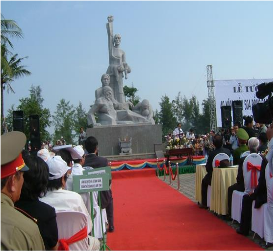
「ソンミ村虐殺慰霊碑前での40周年追悼式典」