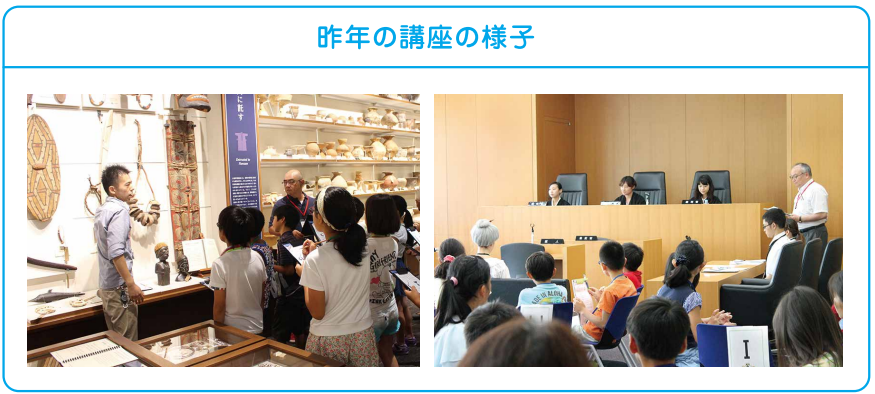
昨年の講座の様子